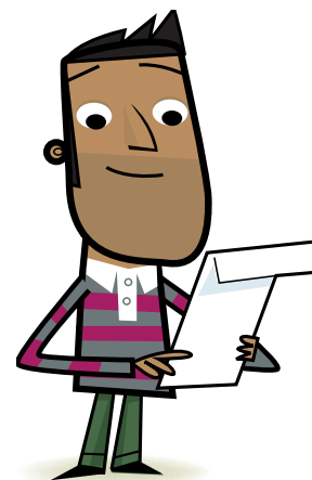
Pracownik Wydziału Cafcass

Przydzielony Tobie pracownik Wydziału Cafcass napisze także ważny list na temat tego jak się czujesz i co jego zdaniem jest najlepsze dla Ciebie – aby poprawić zaistniałą sytuację. List ten zostanie przesłany sędziemu oraz osobom dorosłym, które opiekują się Tobą. Jeśli masz w związku z tym jakiegokolwiek obawy, porozmawiaj z pracownikiem Wydziału Cafcass, który Ci pomoże.